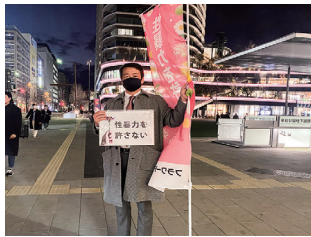
性暴力を許さないフラワーデモ