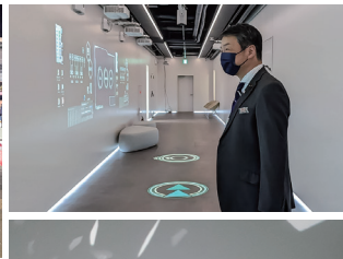
崇城大学IoTセンター視察