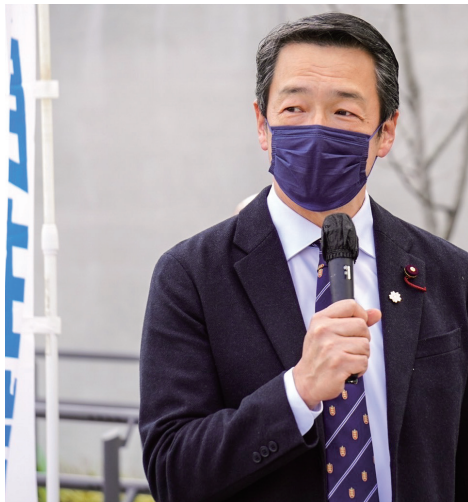
サクラまちにて街頭演説