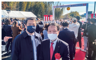
植木バイパス北バイパス開通式