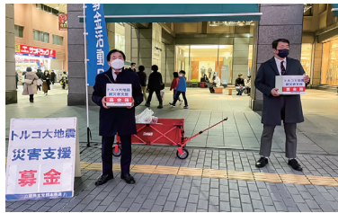
トルコ大地震災害支援募金