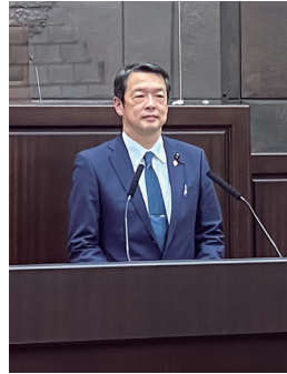
市議会本会議質問